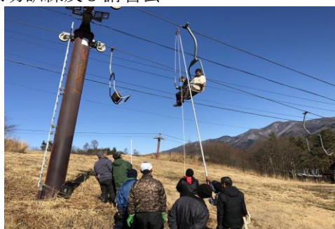
救助訓練及び講習会