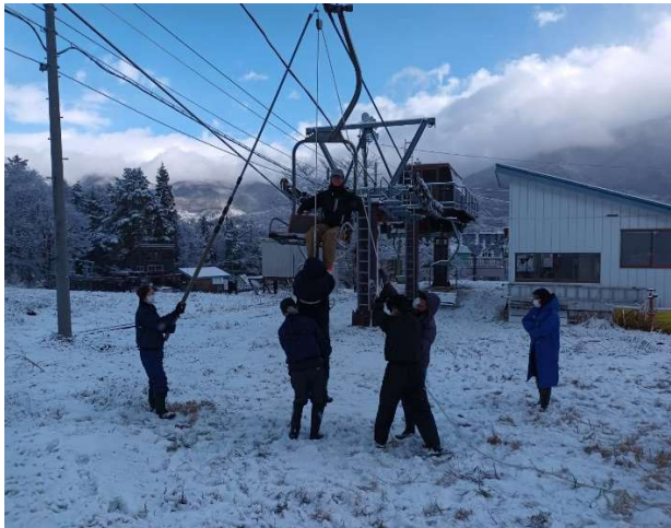
救助訓練及び講習会