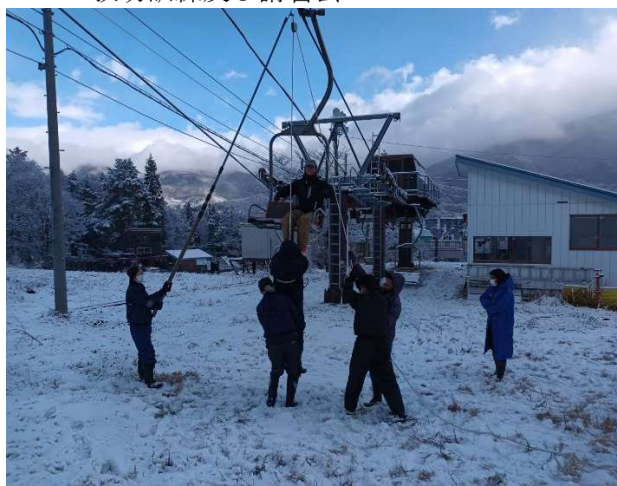
救助訓練及び講習会