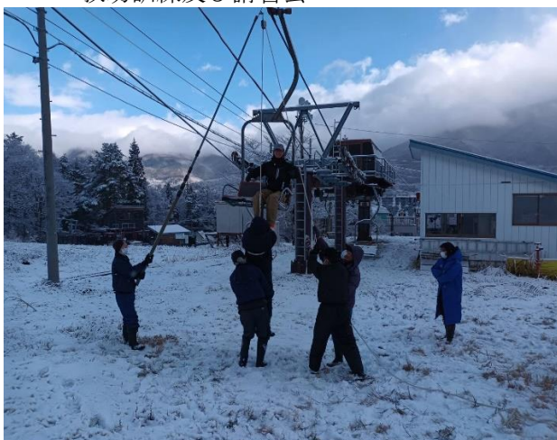
救助訓練及び講習会